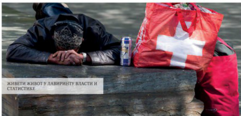
ЖИВЕТИ ЖИВОТ У ЛАВИРИНТУ ВЛАСТИ И СТАТИСТИКЕ

Покушамо ли, пак, да пођемо од званичног статистичког податка да 1,8 милиона, или сваки четврти грађанин Србије, живи на граници сиромаштва и позвемо ли се на анализу Института Кјото