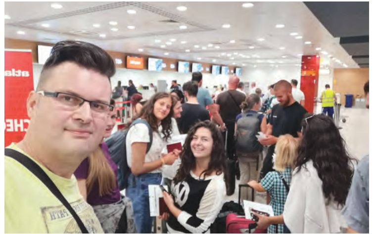
УЧЕСНИЦИ СЕМИНАРА НА БЕОГРАДСКОМ АЕРОДРОМУ

У периоду од 15 година, од како постоји, кроз Удружење је прошло и у његовом раду је учествовало, директно или индиректно, више од 800 младих људи. Од свих студената са хендикепом који су били и остали чланови Удружења и након студирања, само њих троје није завршило факултет, што указује на то да Удружење испуњава једно од својих главних циљева. У пракси се показало да су студенти са хендикепом веома мотивисани да заврше студије, тако да међу свршеним студентима има дипломираних филолога, билога, економиста, правника, медицинара, музичких уметника – соло певање, магистара и доктора наука.