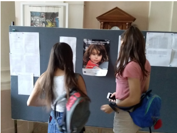
Ученици у Првој крагујевачкој гимназији