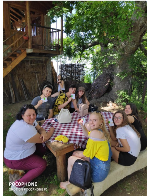
Млади волонтери Црвеног крста Крагујевац су на позоришним сусретима у Охриду, учествовали са представом која има антиратну тематику а у вези са циљем превенције избеглиштва. Током боравка у природи, подељен је промо материјал уз разговор о очувању животне средине