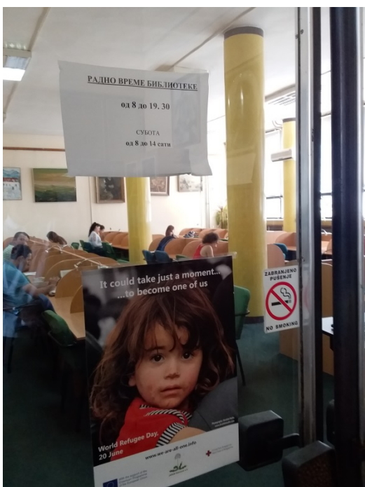
Читаоница за студенте у оквиру Народне библиотеке