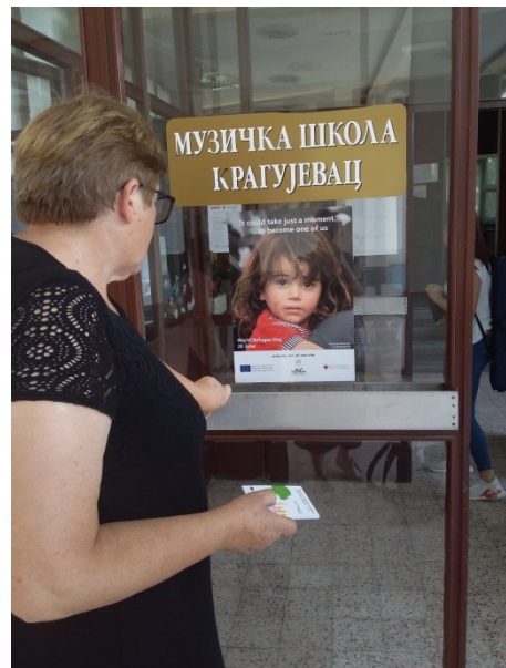
средња Музичка школа